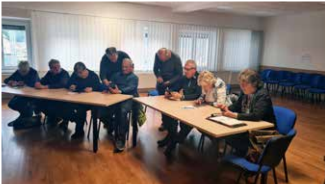
Delavnica na Blokah