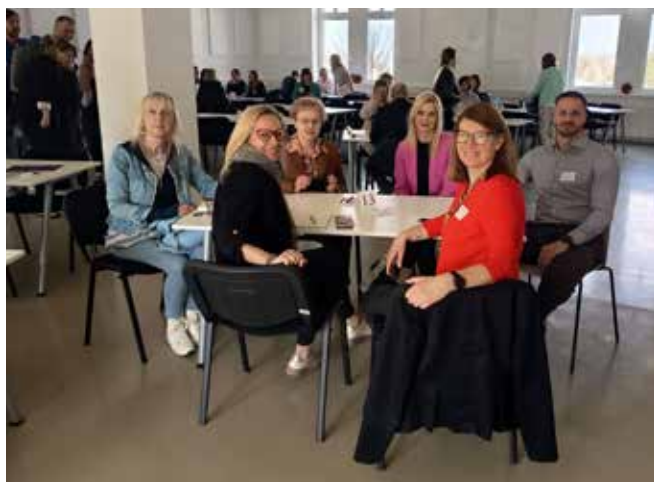
Svetovalci in mentorji SPOT NPR

Notranjsko-primorska regija sodi med najredkeje poseljene regije, tu živi okrog 54 tisoč prebivalcev, zaznamujejo pa jo tudi velike dnevne migracije delovne sile proti Ljubljani in obali. V regiji je približno 5.300 poslovnih subjektov, od tega okoli 1.200 gospodarskih družb in približno 2.700 samostojnih podjetnikov, med katerimi je kar 48 % normirancev. Preostanek predstavljajo zavodi, društva in zasebniki. V regiji je zaposlenih okrog 17.000 delavcev.